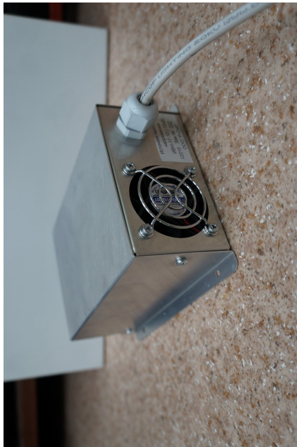
Рис. 3. Внешний вид ИВН-17-10 сзади

Предприятие - изготовитель : ООО "Р - С И Б"