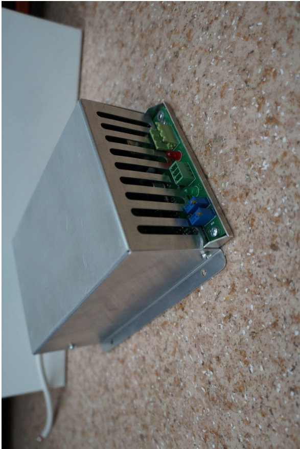
Рис. 2. Внешний вид ИВН-17-10 спереди