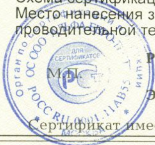
Схема сертификации № 3 Место нанесения знака соответствия по ГОСТ Р 50460-92 – на изделии, упаковке и в со- проводительной технической документации