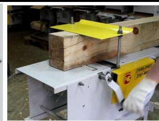
Рейсмусование с механической подачей