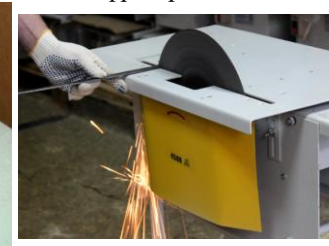
Резка металла и пластмасс, заточка инструмента