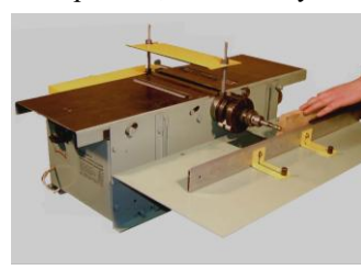
Сверление, долбление, пазование