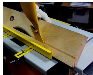
Пиление продольное и поперечное, в т.ч. под углом