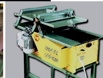
Рейсмусование с автоматической подачей и УБР