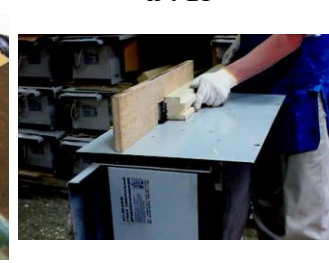
Вертикальное фасонное фрезерование