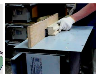
Вертикальное фасонное фрезерование