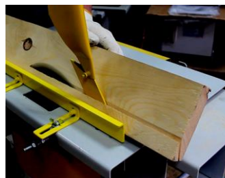
Пиление продольное под углом с Угловой линейкой