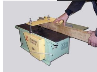
Стругание с прижимом