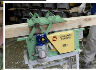
Рейсмусование с автоматической подачей и УБР