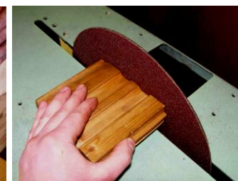
Шлифование, Разрезка металла и пластмасс, заточка инструмента