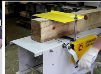
Рейсмусование с механической подачей