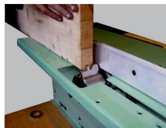
Горизонтальное фасонное фрезерование