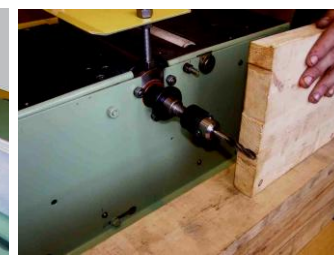
Сверление, долбление, пазование